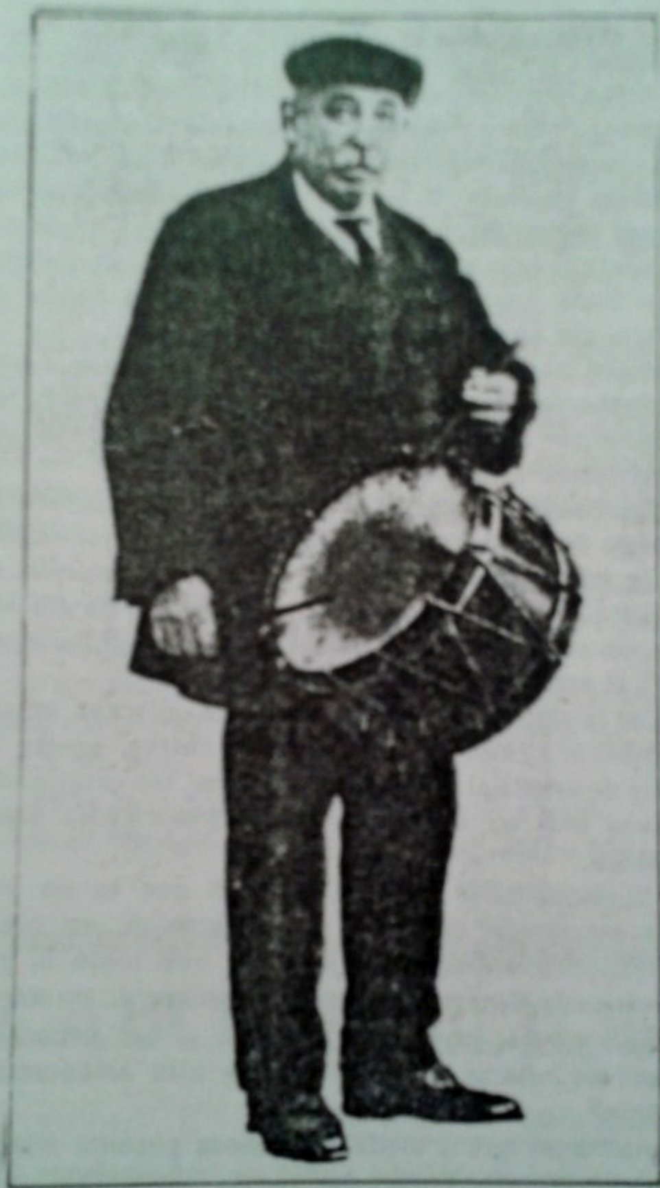
El Atabalero de Placencia de las Armas