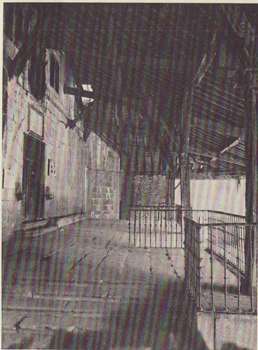
Detalle del Pórtico de la Parroquia de Placencia de las Armas