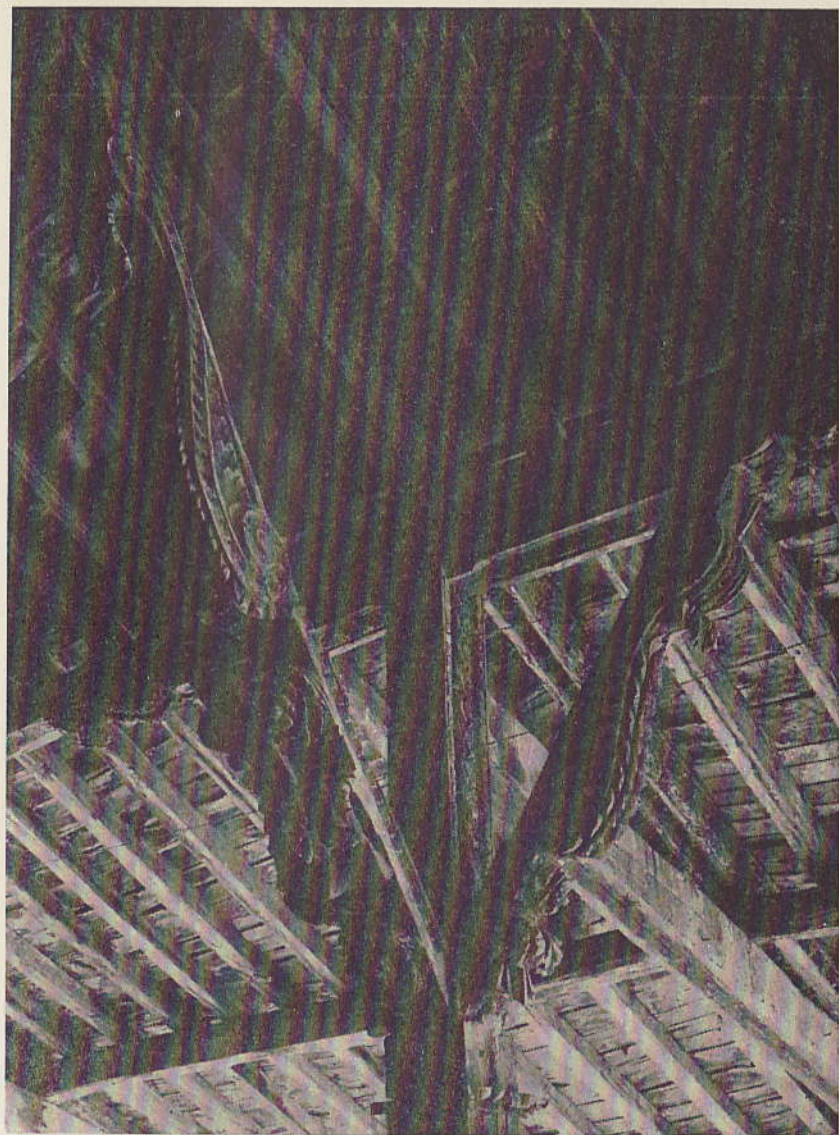
Detalle del Pórtico de la Parroquia de Placencia de las Armas