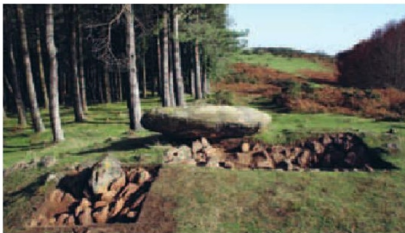
Egituraren eta indusketa eremuaren irudi orokorra.

Interpretazio horri buruz hasiera hasieratik genituen zalantzak berretsi egin dira eskuhartze arkeologikoaren ondoren. Indusketa arkeologikoa elkarren ondoko bi eremu lauki irekiz eginda. Bien artean hartzen zituzten, 2002an ustezko trikuharria arpilatze "kratertzat" jo zena eta begiratu batean, goragunearen punturik garaienean, egitura megalitikoaren ondoan tinkatutako bloke txikia zirudiena. Ustezko bloke txiki hori azaleramenduaren zatia dela egiaztatu da. Landa-re-estalkia kendu ostean ikusi zen, 2002an trikuharriaren tumulutzat jo zen goraguneak jatorri naturala duela. Jalkina kendu ahala ikusi zen, ustezko arpilatze-kraterra bertako haitzaren mozketak antropikoa