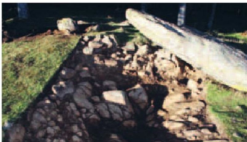
Monolitoa sartuta egon zeneko zuloa.