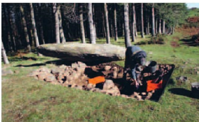
Lan prozesuaren irudi bat.